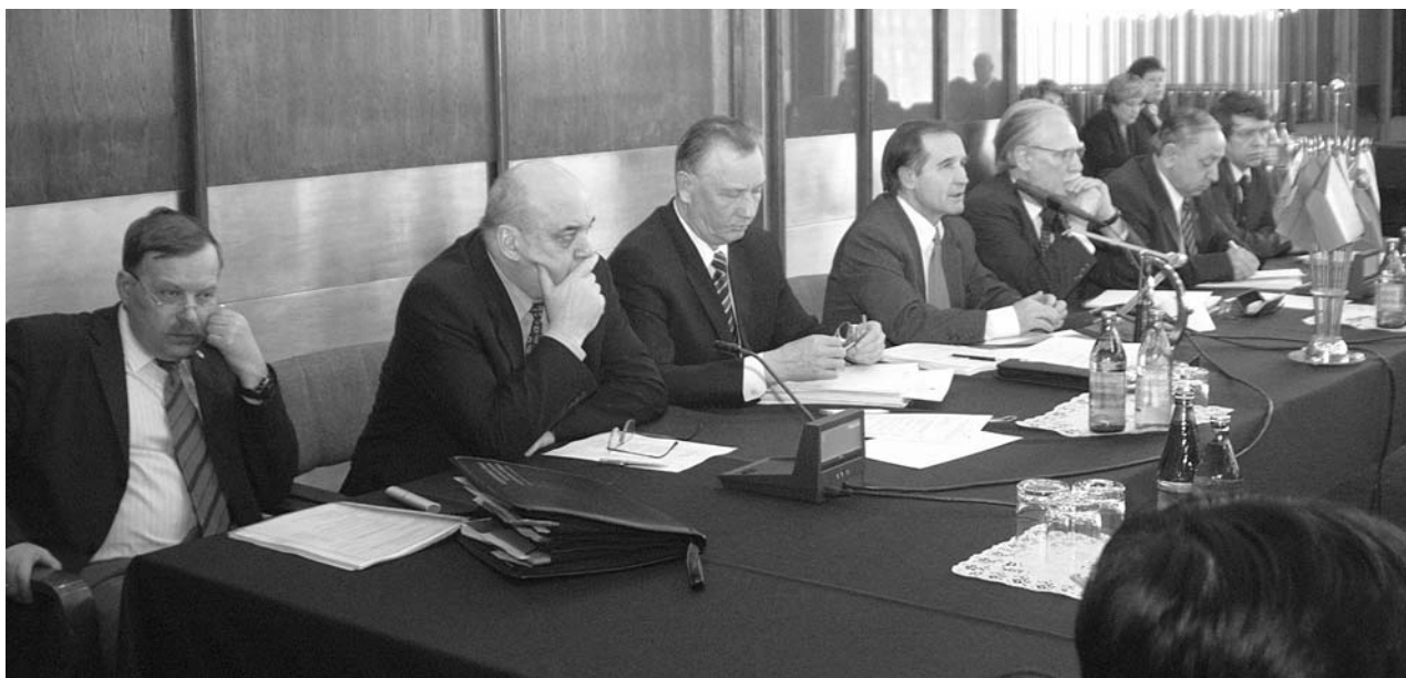
Дубна, 18 марта. Заседание Комитета полномочных представителей правительств государств-членов ОИЯИ