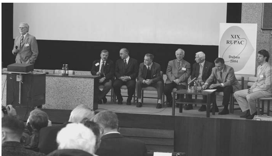
Дубна, 4–9 октября. XIX Российская конференция по ускорителям заряженных частиц (RUPAC-2004)