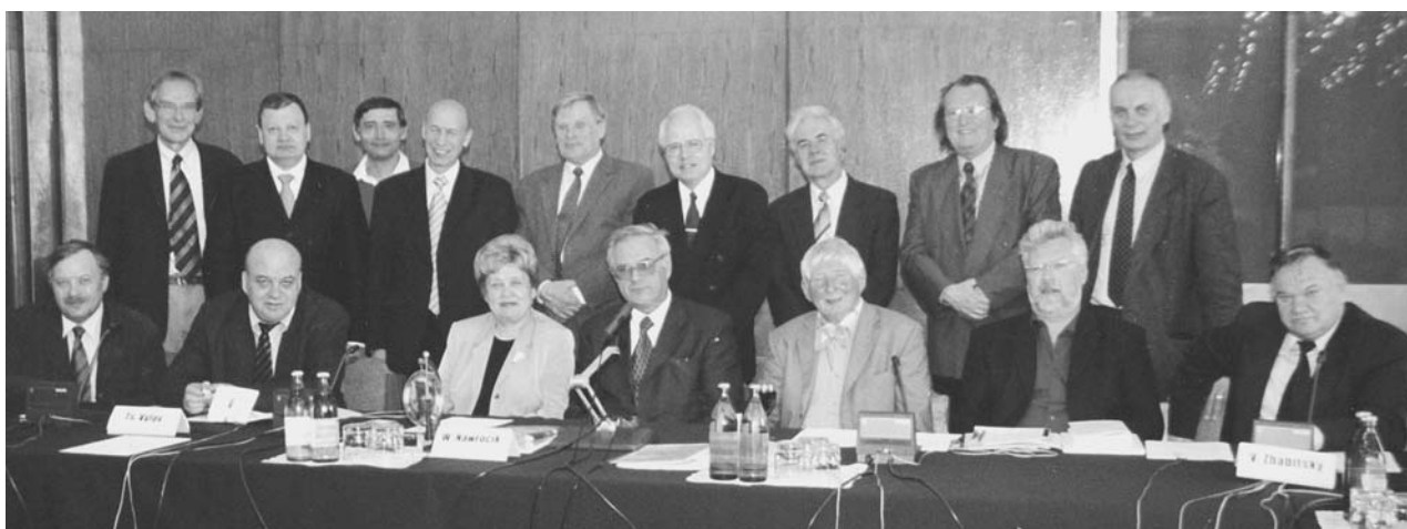
Дубна, 19–20 апреля. Участники сессии Программно-консультативного комитета по физике конденсированных сред