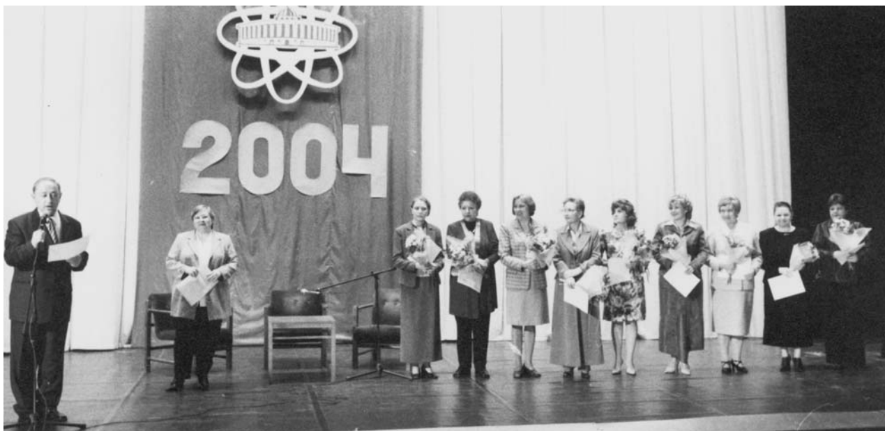
Дубна, 26 марта. День образования ОИЯИ. На сцене Дома культуры «Мир» лауреаты конкурса учителей Дубны — стипендиаты ОИЯИ 2004 года