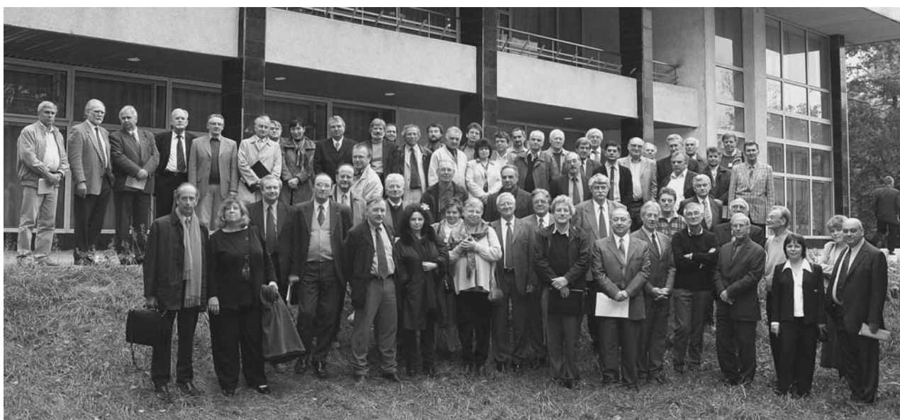
Дубна, 30 сентября. Международный семинар «ОИЯИ–IN2P3 (Франция) — 30 лет плодотворного сотрудничества»