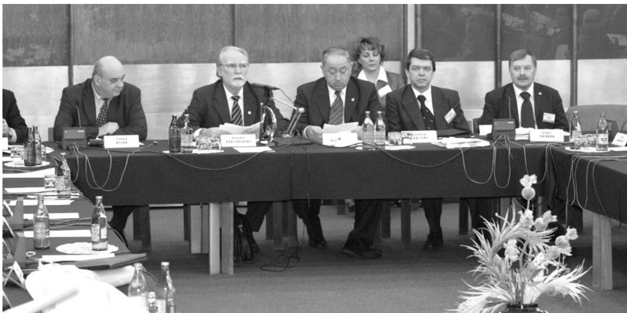
Дубна, 15 января. 95-я сессия Ученого совета ОИЯИ