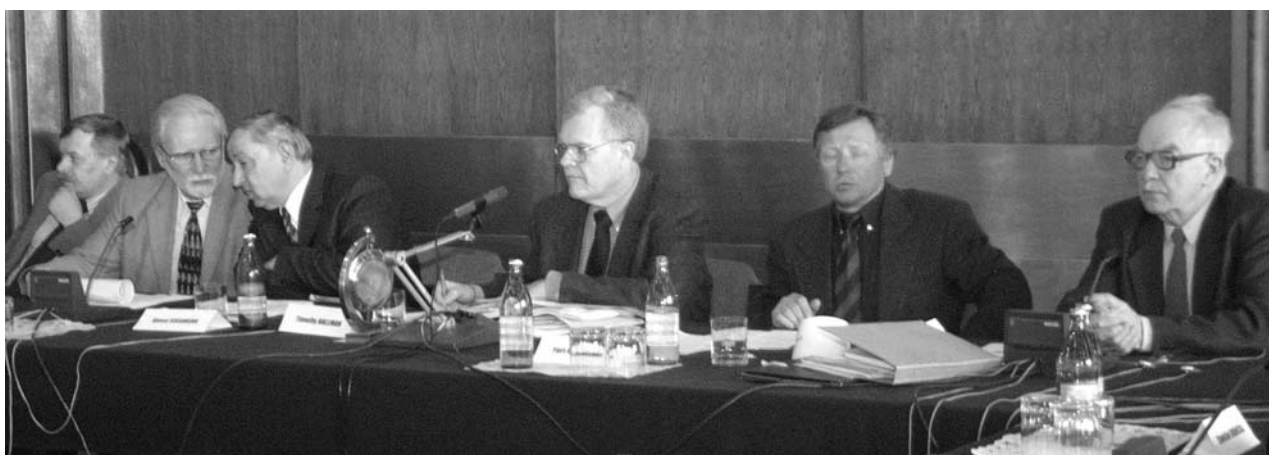
Дубна, 5–6 апреля. Сессия Программно-консультативного комитета по физике частиц