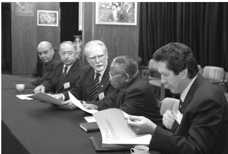
Дубна, 15 января. Гость ОИЯИ Чрезвычайный и Полномочный Посол ЮАР Мочубела Й. Сику (второй справа)