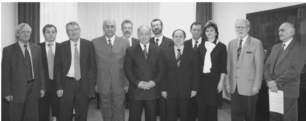
Дубна, 11 декабря. Участники церемонии подписания Соглашения между ОИЯИ и Словакией о сотрудничестве