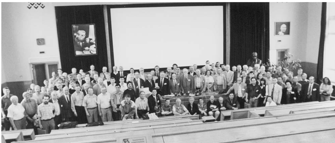
Дубна, 6 сентября. Боголюбовская конференция «Проблемы теоретической и математической физики»