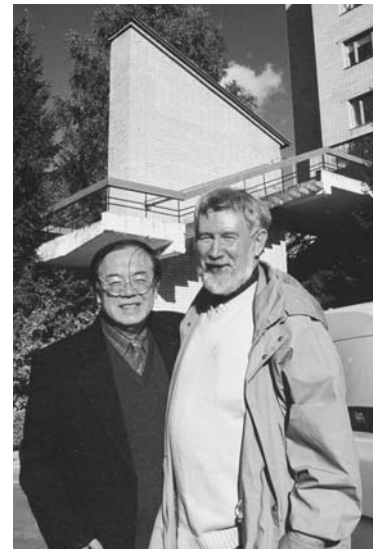
Дубна, 14 сентября. Визит в ОИЯИ делегации Китайского ядерного общества