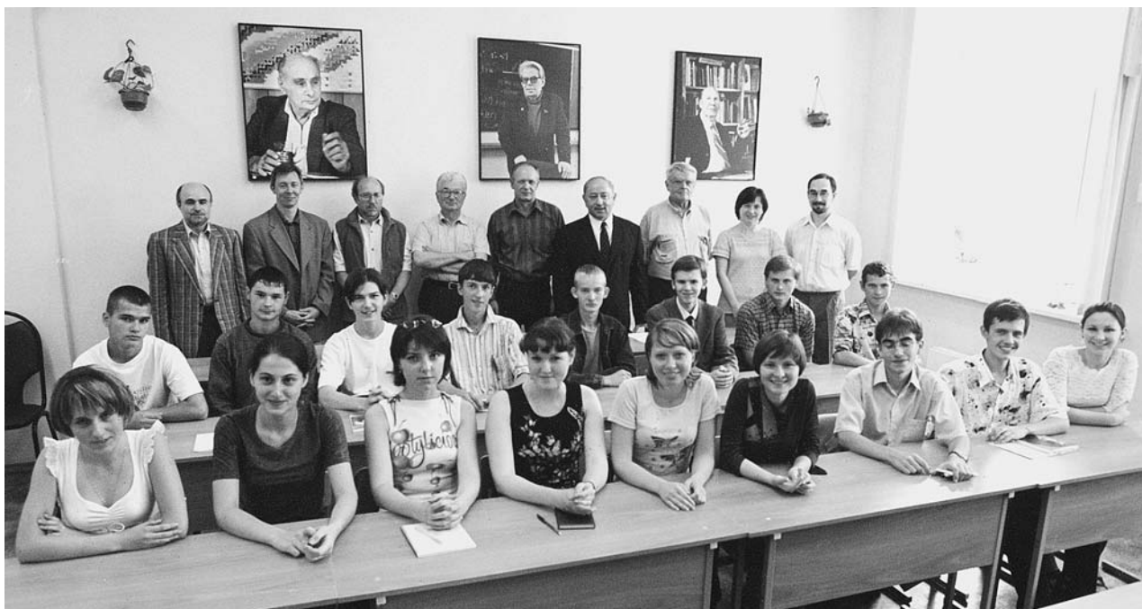
Университет «Дубна», 1 сентября. Встреча профессорско-преподавательского состава кафедр теоретической и ядерной физики со студентами-первокурсниками кафедр