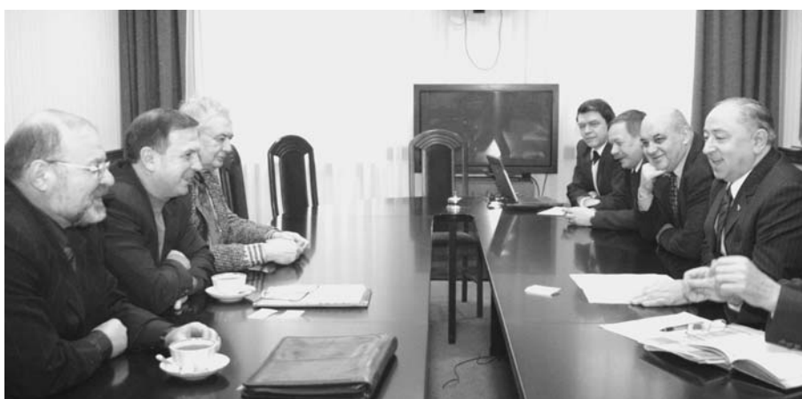
Дубна, 5 февраля. Визит в ОИЯИ делегации Украины во главе с полномочным представителем правительства Украины в ОИЯИ В. С. Стогнием (второй слева)