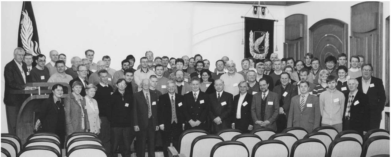
Минск, 2 декабря. Участники 9-й конференции коллаборации RDMC–CMS