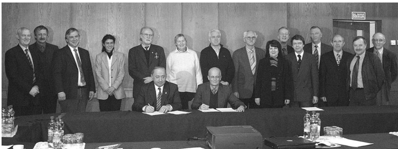
Дубна, 17 февраля. Участники 14-го заседания Координационного комитета ВМВФ–ОИЯИ